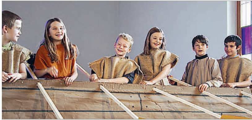
Wie kommt ein König als Sklave auf eine Galeere?

Die Unter- und Mittelstufe führte in diesem Jahr das Musical «D Legände vom vierte König» von Markus Hottiger auf. Mit grossem Engagement spielten und sangen die 1. bis 6. Klassen vom vierten König, der im Unterschied zu seinen bekannteren Gefährten einen etwas anderen Weg einschlägt, um zum neugeborenen Christkind zu gelangen. Es ist aber gerade dieser beschwerliche Umweg und seine Bereitschaft alles mit den Mitmenschen zu teilen, welche die Besucher an die wahren Werte von Weihnachten erinnern sollten.