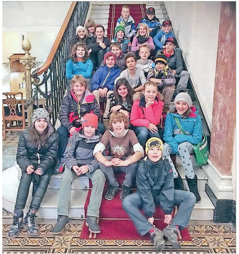
Die noble Lenker Delegation im Nobelhotel Schweizerhof.