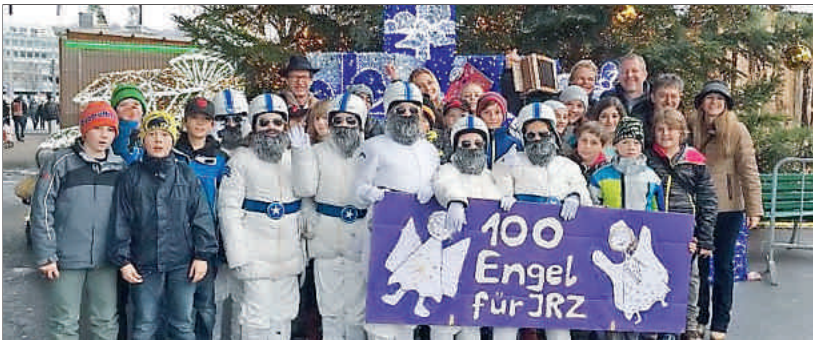
Die ganze Delegation vor dem KKL in Luzern.