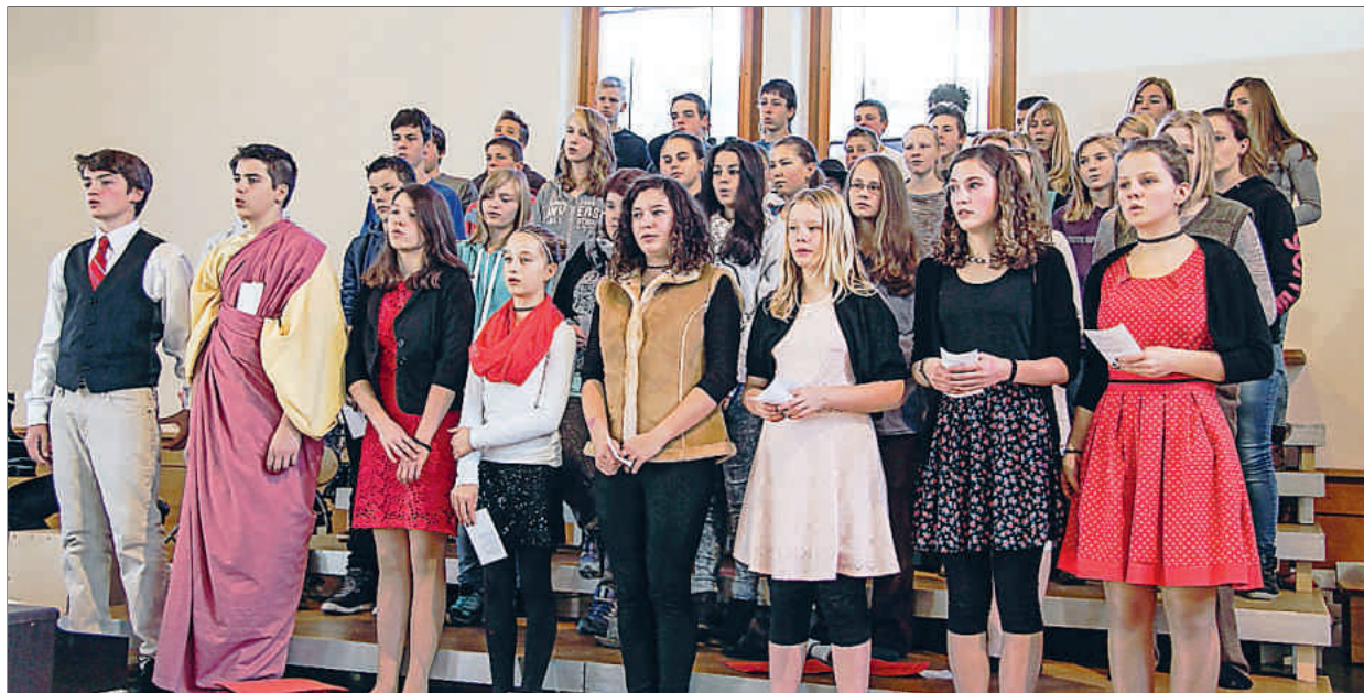
Die rund 50 Schülerinnen und Schüler der Oberstufe vermochten auch stimmlich zu überzeugen.